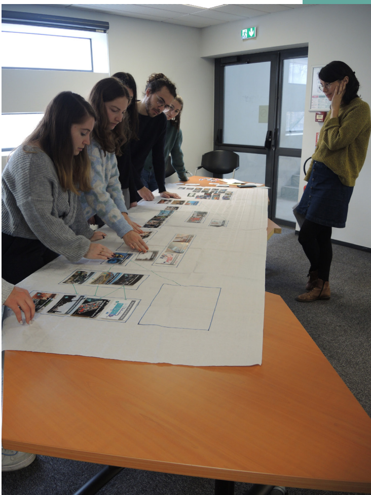
Des étudiants en formation à l'IAE Angers lors d'un atelier "Fresque du textile"

Dans le cadre des activités de la Chaire EARTH, le Centre Jean Bodin, le Granem et le Qu4tre, se sont associés pour organiser deux journées thématiques les 13 et 14 novembre 2024 , les Ecofashion Days, un évènement sur la mode responsable. Notre objectif ? Sensibiliser le grand public (étudiants, enseignants, chercheurs, personnes extérieures) aux enjeux artistiques, économiques, politiques, sociétaux et écologiques de la seconde vie des vêtements.